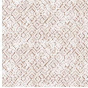
6038 Beige 63 Motif d'impression