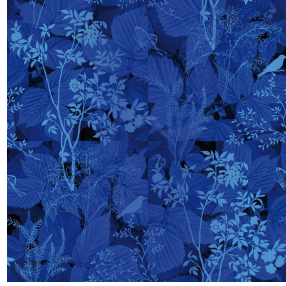
ODE Bleu 41 Motif d'impression