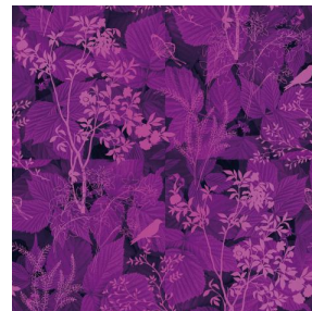
ODE Lilas 19