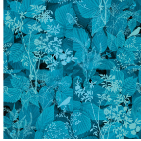
ODE Turquoise 53 Motif d'impression