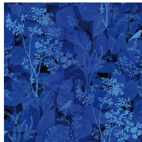
ODE Bleu 41