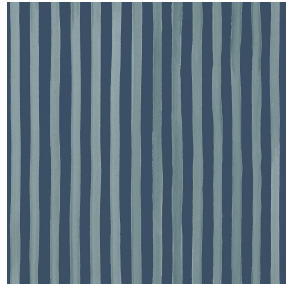
SONG Titanium 98 Motif d'impression