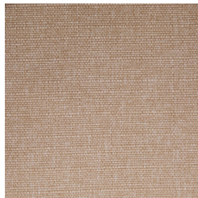
MUNA Saumon 143 Motif d'impression