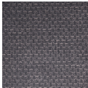
RUSTIC Titanium 98 Motif d'impression