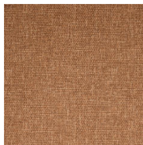
MUNA Sienna 29