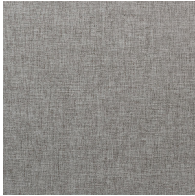
NORA Gris envers blanc 63 Support d'impression