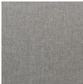
NORA Gris envers blanc 63 Support d'impression