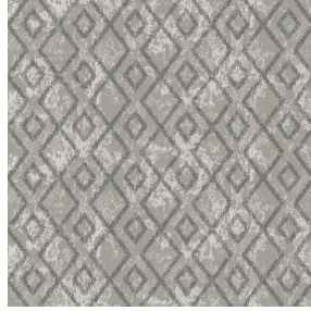
6041 Taupe 95 Motif d'impression