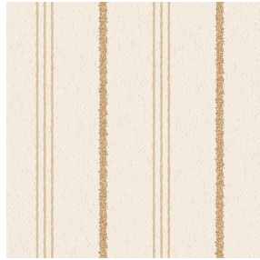
LIAM Naturel 26 Motif d'impression