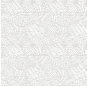
6046 Naturel 26 Motif d'impression