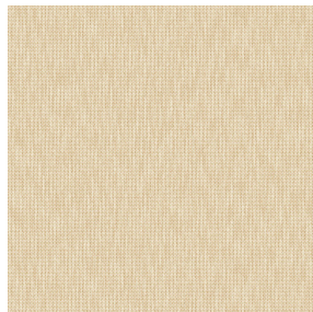
CALI Naturel 26 Motif d'impression