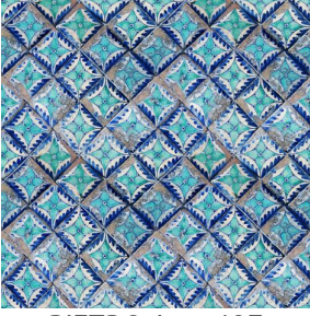
PIETRO Azur 137