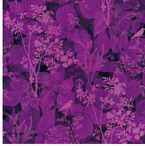
ODE Lilas 19 Motif d'impression