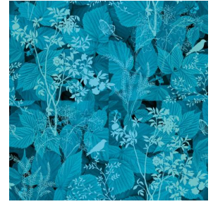
ODE Turquoise 53