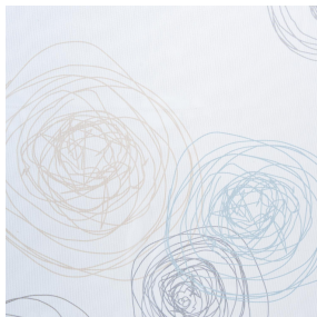
NAHIA OR 94 Motif d'impression