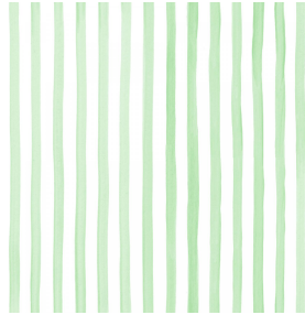
SONG Tilleul 103 Motif d'impression