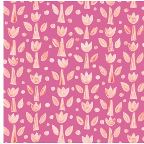
TULIPE Rose 129 Motif d'impression