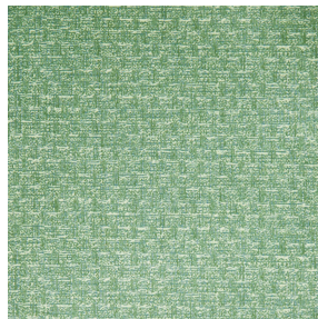
RUSTIC Prairie 125 Motif d'impression