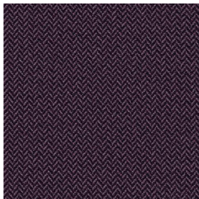
SCOURTIN Ébene 113