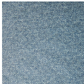
ANATOLE Celadon 135 Motif d'impression