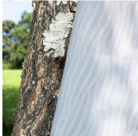
SABLE Jasmin 74 Motif d'impression