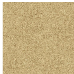
ELAINA Beige 63