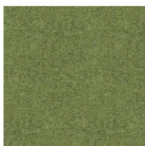
ELAINA Lierre 124