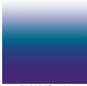
ZADIG Bleu 41