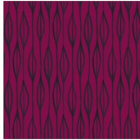
YENDI Opéra 104 Motif d'impression