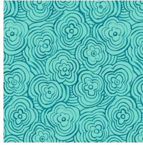
ONDES Turquoise 53