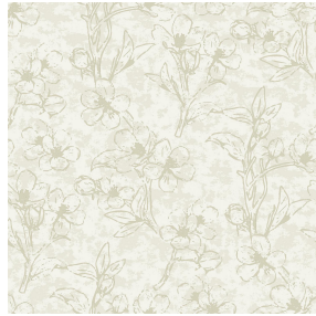
6048 Beige 63 Motif d'impression