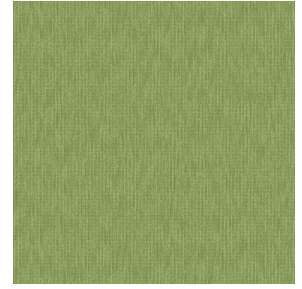
CALI Lierre 24