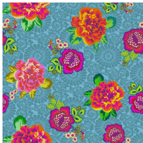
INDRA Fiesta 131 Motif d'impression