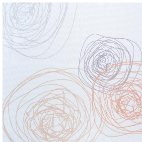
NAHIA CURRY 184