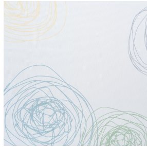
NAHIA TURQUOISE 53 Motif d'impression