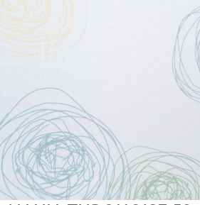
NAHIA TURQUOISE 53