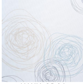
NAHIA OR 94