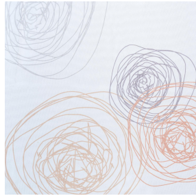
NAHIA CURRY 184 Motif d'impression