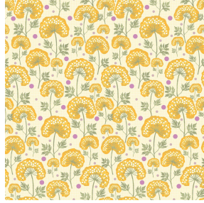
OMBELLE Soleil 127 Motif d'impression