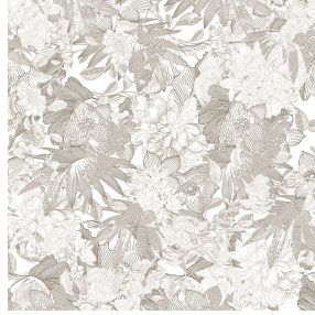
6105 Beige 63 Motif d'impression