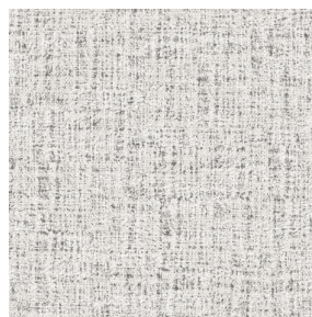
MURA MASTIC 48