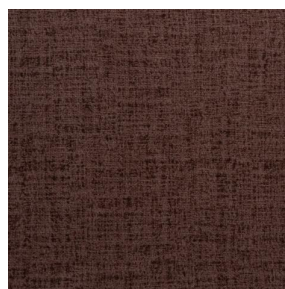
MURA TERRE 107