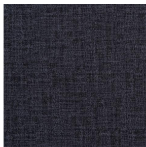
MURA NOIR 10