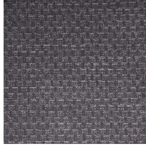
RUSTIC Titanium 98 Motif d'impression