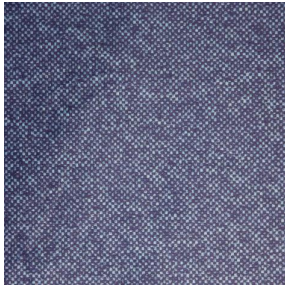
ANATOLE Océan 91