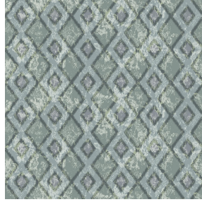
6032 Minéral 157 Motif d'impression