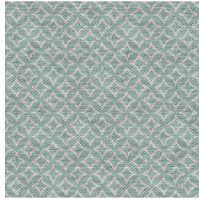
6036 Minéral 157 Motif d'impression