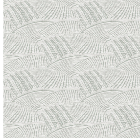
6061 Naturel 26 Motif d'impression