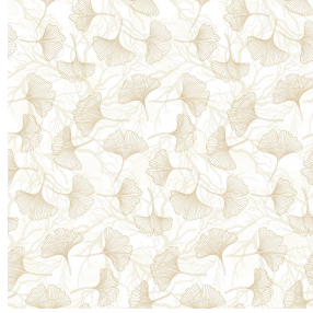
6060 Naturel 26 Motif d'impression