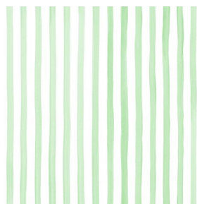
SONG Tilleul 103