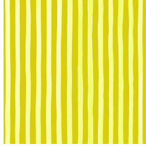
SONG Agrume 69 Motif d'impression