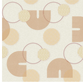
6013 Ocre 03 Motif d'impression