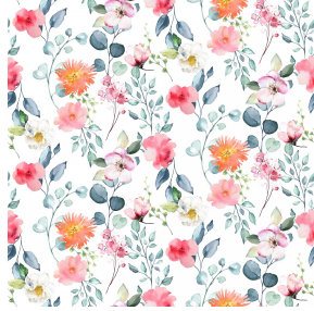
FLORES Multico 98 Motif d'impression