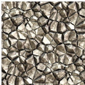
SAPHIR Naturel 26