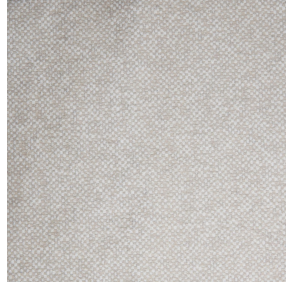
ANATOLE Naturel 26 Motif d'impression