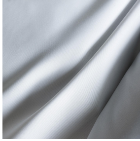
POL 00 Support d'impression