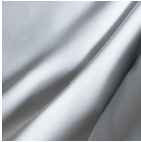
POL BPI 00 Support d'impression