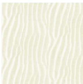
SABLE Ivoire 115