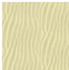
SABLE Sable 67