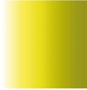
ZENITH Anis 62