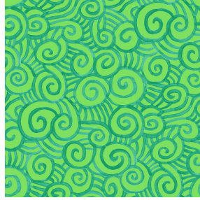
TUMULTE Prairie 125 Motif d'impression